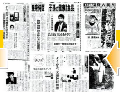
スーパーST発売直後は週刊誌、新聞などマスコミ各紙に大きく取り上げられました。