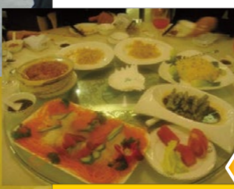
食事は体質に合わせた薬膳料理です。