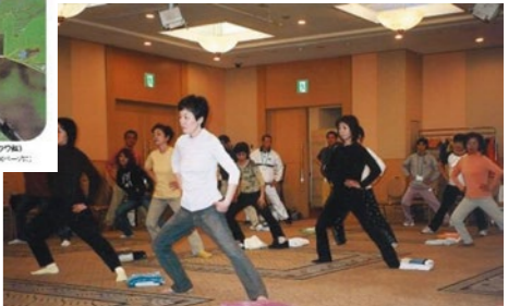
2005年(平成17年)4月、骨盤股関節体操発表会。