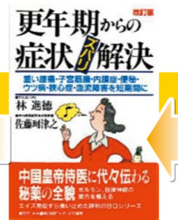
林進徳著「更年期からの症状ズバリ解決」を出版。1996年(平成8年)11月。