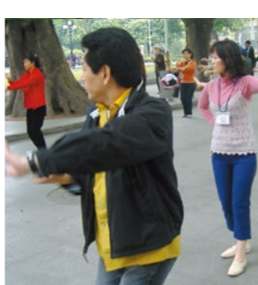
市民の太極拳グループに入れてもらいました。