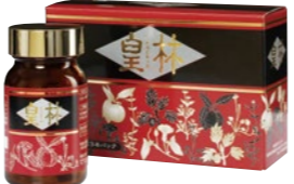
1998年(平成11年)「皇林」誕生。