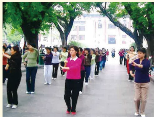
広州市での早朝、太極拳をしている市民グループの仲間に入れてもらって(2006年11月)

研修ツアーが2001年(平成13年)に実施されました。この中国本土への研修ツアーは4回続きました。