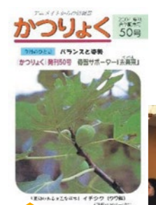
「かつりよく」50号 2004年10月発行。当時は20ページの小冊子でした。