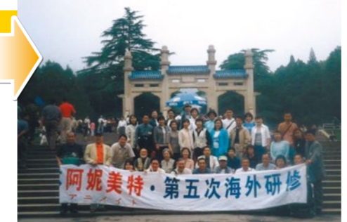
2001年(平成13年)第5回海外研修ツアーは、初めて漢方の本場中国へ行きました。参加者は38名。蘇州、無錫南京上海の旅でした。南京中医药大学での大歓迎、無錫市民の家庭での夕食会など感激の研修ツアーした。