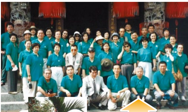
1997年6月、第1回海外研修ツアーを台湾で実施。参加者45名、揃いのポロシャツで勢揃い。ライチ、マンゴーが食べ放題でした。