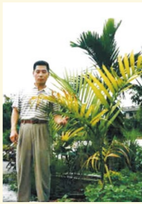
林家の自然農園の一角に一年前に記念植樹した“びんろう樹”、もつ背丈と同じ位に(1998年6月)

翌年(1997年)6月には初めての海外研修ツアー「台湾・林先生の故郷を訪ねる」を開催し、前年以上の売り上げを計上させ