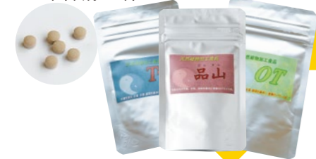
臓器(肝・心・脾・肺・腎)別と機能(気・血・水)別の「漢方サプリメント」『林方シリーズ』発売! 2012年(平成24年)