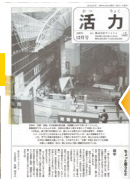
1996年12月「かつりよく」創刊号発行。題字は漢字でした。