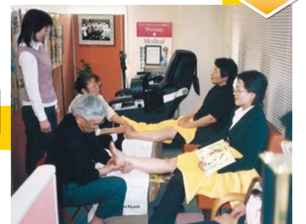
「足裏健康法」講習会