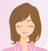
今回のテーマ ▶ 「肌アレルギー」

甘いもの、脂分の多いものを控え、消化のよいものを中心とした食事を摂ることをお勧めします。ウーロン茶、緑茶、ドクダミ茶などを多めに飲むことを習慣にすることも効果的です。