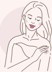
アニメイトのジェルは是非入り!

脂肪が燃えず、太りやすくなる。 リンパは、インナーマッスルと呼ばれる深層の筋肉をほぐすことで、流れが促されます。リンパが滞ると、リンパ液の中の中性脂肪や老廃物が体の中にとどまり、脂肪を引き寄せることに。また、ついでにしまった脂肪も深層の筋肉運動により燃焼されるため、運動不足が続くと、脂肪が燃えず、太りやすくなります。