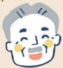
東京都 K・H 様(男性)

私と同年代の人は、ほとんどの方が白内障(目を力メラに例えると、レンズに当たる水晶体が白く濁る眼病のこと)になっていると聞きます。しかし、今のところ私に白内障の気配はありません。これもこの機械のおかげと、本当に感謝しています。