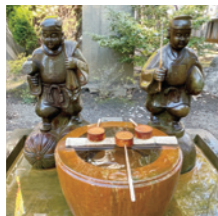
亀戸香取神社の恵比寿神と大国神。