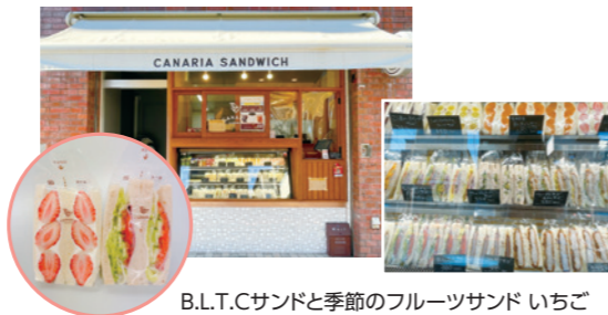
B.L.T.Cサンドと季節のフルーツサンド いちご

東京都江東区亀戸3-44-13 営業時間 8:30 ~ 売り切れ次第終了(月休)