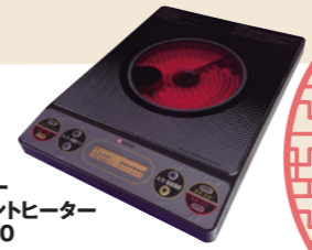
スーパーラジエントヒーター FG-800