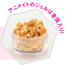
アニメイトのジェルは全入り!

わきを伸ばすストレッチをすると、鎖骨・胸・わきの下のリンパ節のリンパの流れがよくなります。また、体のわきを伸ばし、硬くなった体をほぐすことで副交感神経にも作用するので緊張感から解放されます。