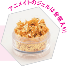
アニメイトのジェルは全入り!

自律神経のバランスが崩れると、気分が沈みがちに。リンパが多く流れる背中は、自律神経の通り道でもあります。背中の筋肉の緊張をほぐし、リンパとともに自律神経を整えることで、気分が晴れやかに。