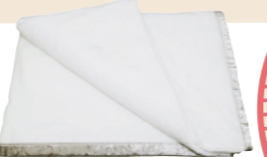
プラチナフォトン®ブランケット