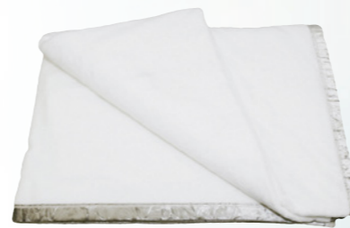
名称:プラチナフオトン® ブランケット 原材料名:ポリエステル(プラチナフオトン繊維) 50%、綿50% サイズ:140×200cm

光触媒によって繊維自体が抗菌防カビ、防ダニ効果を持ち、羽毛や綿などの動植物繊維を使用していないことからアレルギーの要因となるダニがつきにくい性質があります。