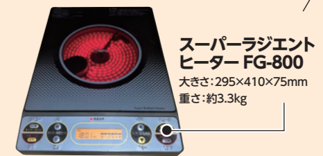
スーパーラジエントヒーター FG-800 大きさ:295×410×75mm 重さ:約3.3kg